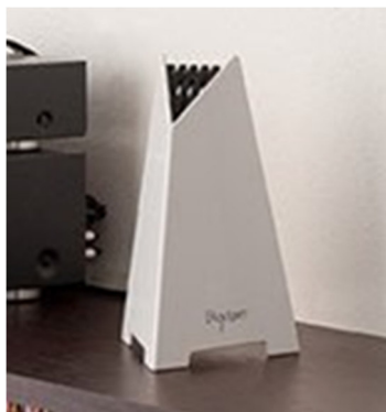
Tris (da appoggio x camere, piccoli uffici, abitazioni)