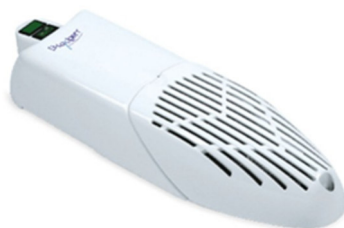
Maia (da appoggio o parete x uffici, palestre, spogliatoi, abitazioni)