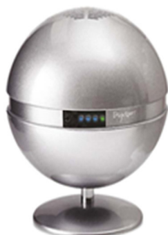
Mistral (soffitto o parete x Studi Uffici, aziende, grandi ambienti)