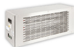
Purho (da soffitto x grandi ambienti)

Bioxigen ha una gamma completa di dispositivi installabili all'interno di Canalizzazioni di Impianti ad aria forzata e U.T.A. per grandi superfici e ambienti riscaldati e climatizzati ad aria*.