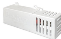
Airy (da parete x Autobus, ascensori, piccoli ambienti)